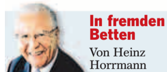
In fremden Betten Von Heinz Horrmann

Heutzutage sind die Häfen, auch die nobelsten und einst exklusiven, dem Ansturm der Billiganbieter ausgeliefert. Doch selbst auf den „Rennstrecken“ der Kreuzfahrtschiffe, die Zugvögeln gleich der Sonne entgegenstreben, gibt es mindestens ein Schiff, das die Wellen des Massentourismus schneidet. Nach dem 37-Euro-Schockerlebnis auf der „Easy-Cruise“ möchte ich heute das andere Extrem vorstellen: Die „MS Europa“, das weltbeste Angebot dieser Urlaubsform mit den höchsten Zuwachsraten.