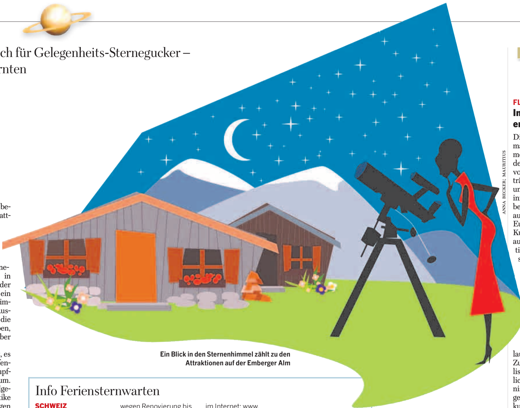
Ein Blick in den Sternenhimmel zählt zu den Attraktionen auf der Emberger Alm